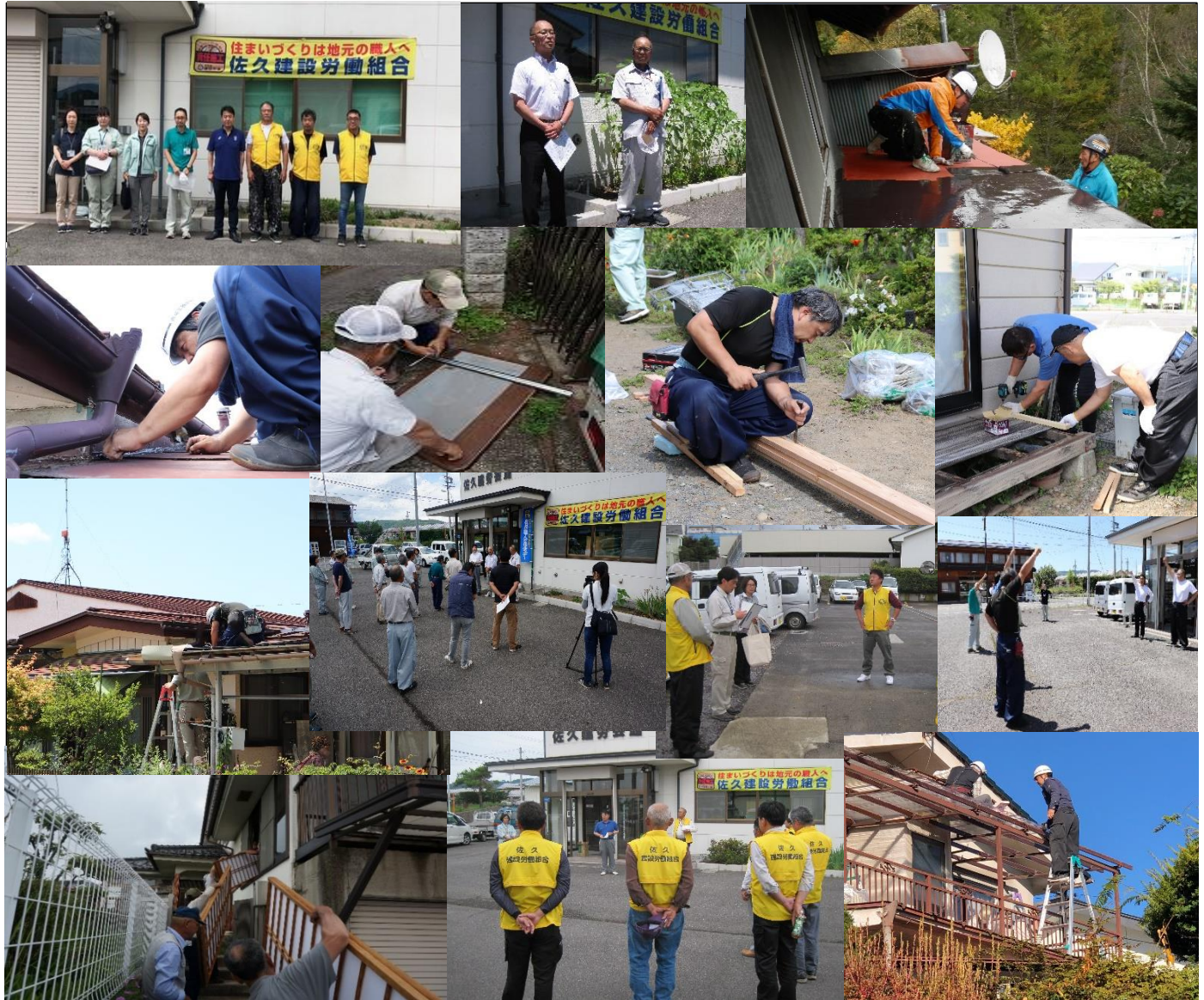
「佐久市住宅デー」と「小諸住宅デー」の様子を集めました。

発行人 〒384-2102 佐久市塩名田488-1 佐久建設労働組合 TEL (0267) 58-2404 FAX (0267) 58-2304 責任者 西郷 徳幸